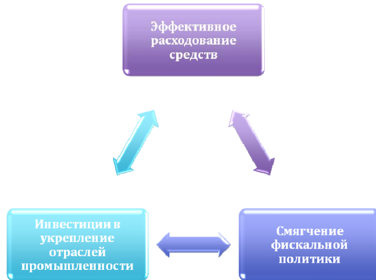
Рис. 2. Рекомендуемые меры по преодолению последствий мирового финансового кризиса

В целом, согласно прогнозам, можно сделать вывод, что ожидаемый экономический рост продолжит оказывать воздействие на аккумуляцию финансовых средств домашних хозяйств в регионе. Улучшение финансового благосостояния домашних хозяйств приведет к увеличению уровня проникновения благосостояния по отношению к ВВП до 61% в 2012 году. Наибольшего роста (порядка 25% в год) можно ожидать в быстро развивающихся странах, таких как Сербия, Румыния, Хорватия.