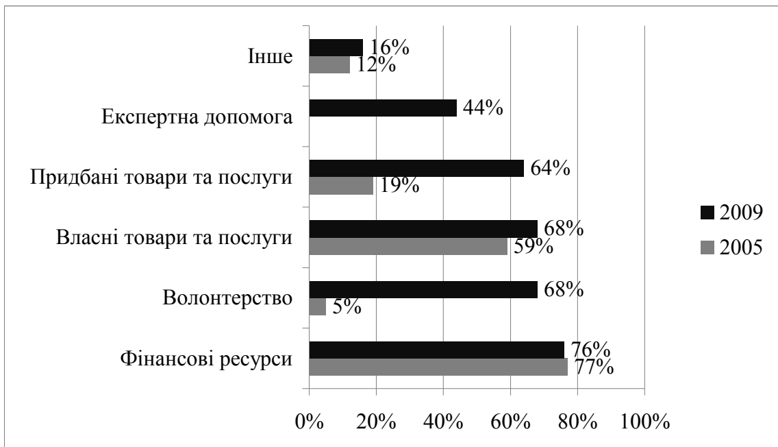
Рис. 1. Тенденції використання форм надання благодійної допомоги в українських компаніях (% від загальної кількості досліджуваних компаній) [7, с.30]

Тенденції реалізації форм корпоративної філантропії в українському бізнес – середовищі за 2005 – 2009 рр. характеризуються розширенням кількості форм ( нова форма – експертна допомога) та зміною акцентів в обранні форми допомоги у вигляді волонтерства, надання товарів та послуг не пов'язаних з діяльністю компанії. [див. рис.1].