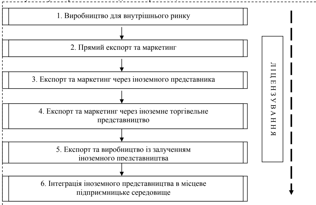
Рис. 1. Етапи інтернаціоналізації ТНК

Для аналізу причин інтернаціоналізації як теоретичне підґрунтя використаємо дослідження Дж. Даннінга, який виділяв 3 групи переваг здійснення фірмою господарської діяльності за кордоном: "ownership special advantages" - особисті переваги (О-переваги), "location specific variables" - переваги розташування (L-переваги) та internalization incentive advantages – переваги інтерналізації (І-переваги) [3, с. 201]. О-переваги ґрунтуються на особистих активах, притаманних ТНК (знаннях), завдяки яким вона бере гору над конкурентами. L-переваги стосуються умов країни, де розташовується ТНК. Нарешті, переваги інтерналізації (І-переваги) стосуються можливостей засвоїти (або інтерналізувати) ринок, включаючи його до організації ТНК - у тих випадках, коли ієрархічне рішення (організація філій ТНК у країні) є економічно доцільнішим, ніж просте поринання у ринкові операції. Характер взаємодії цих чинників може наочно змінюватися з плином часу. Скажімо, О-переваги фірми можуть збільшитися, якщо країна знайде певні місцеві активи (наприклад, людські ресурси), які збільшуватимуть переваги ТНК завдяки інтерналізації.