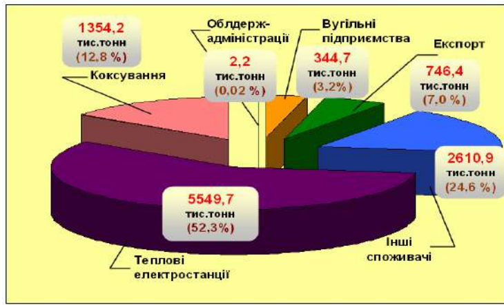
Рис. 1. Структура та обсяги поставок товарної вугільної продукції, виробленої підприємствами Мінвуглепрому, у січні-травні 2010 р.

Протягом січня-травня 2010 року державними підприємствами вироблено товарної вугільної продукції на суму 5340,1 млн. грн., порівняно з відповідним періодом 2009 року – на 627,6 млн. грн. (на 13,3%) більше.