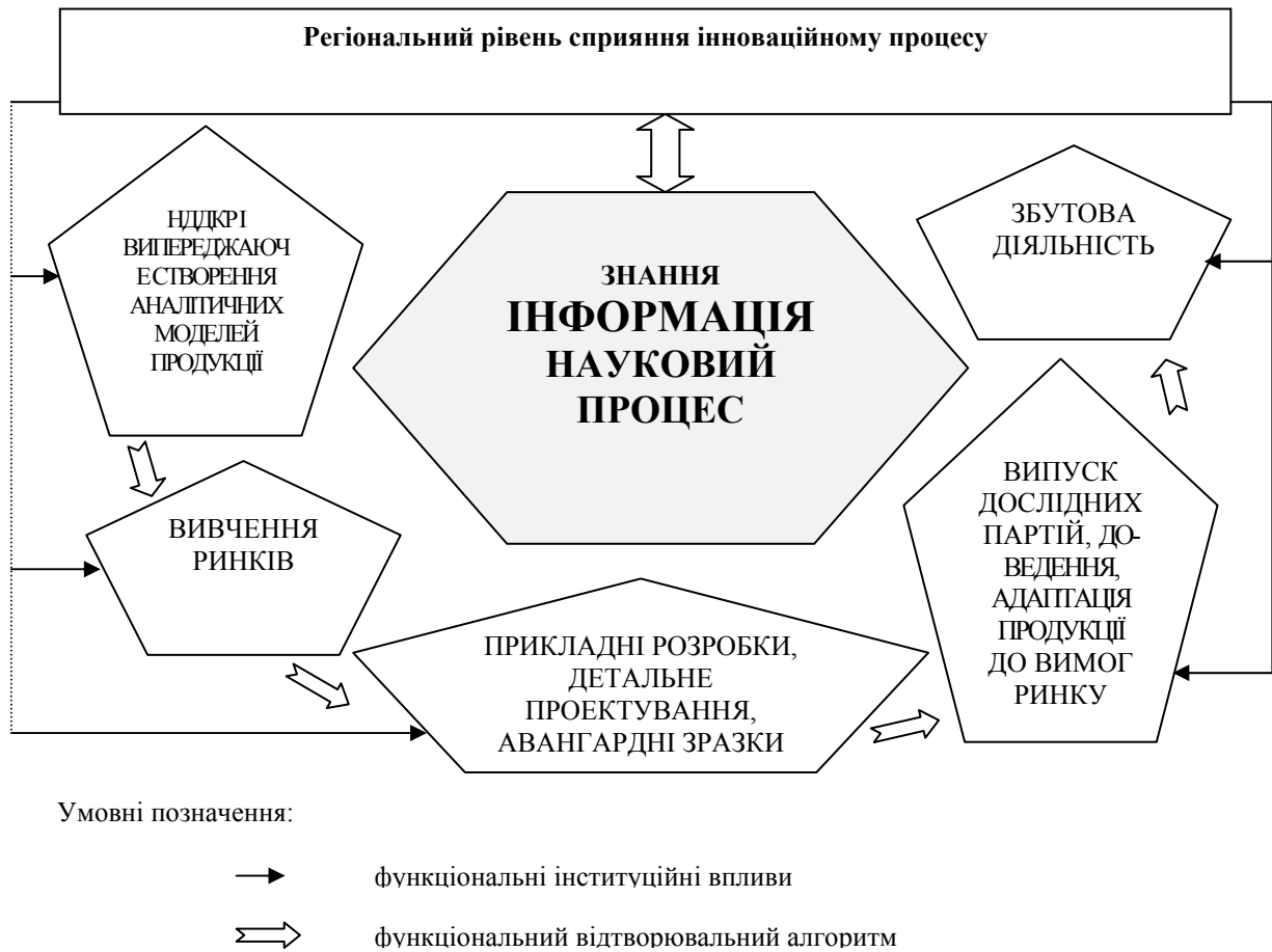
Рис. 2. Система регіонального сприяння реалізації інноваційного процесу інформаційної доби (модель активної матриці)

Розвиток міжнародних зв'язків України, посилення самостійної зовнішньої діяльності адміністративно-територіальних суб'єктів держави протягом останніх років об'єктивно підвищують значення прикордонної співпраці. Слід враховувати, що й розширення ЄС за рахунок вступу до нього східноєвропейських країн, що відбулося за останні роки, об'єктивно посилило значення цього процесу, присунувши кордон ЄС впритул до України.