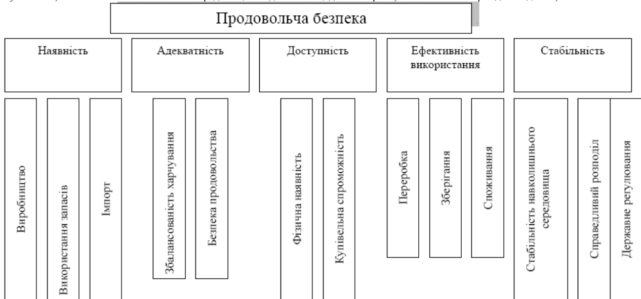
Рисунок 2 – Запропонована модель продовольчої безпеки держави

Для оцінки стану й меж продовольчої безпеки на державному й внутрішньодержавному рівнях більше прийнятні методичні підходи, основу яких становить принцип достатнього й збалансованого харчування, що враховує фізіологічні норми харчування населення вік, професію, місце проживання й національні особливості. Показники або індикатори, що включають різний спектр характеристик, становлять модель національної продовольчої безпеки (див. рис. 2).