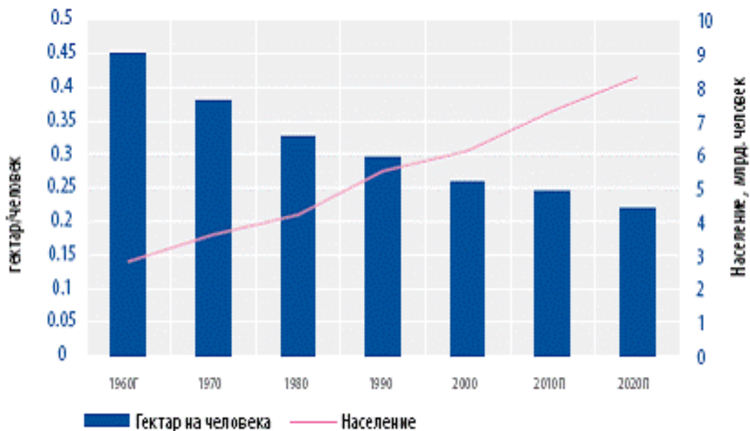
Рис. 1 Прогноз изменения количества посевных площадей в мире в расчете на 1 человека

Чтобы сельское хозяйство могло удовлетворить растущий спрос, необходимы разумная политика и долгосрочные инвестиции. Рост продуктивности сельского хозяйства жизненно важен для стимулирования роста других секторов экономики. На фоне постоянно растущего спроса (рис.1) и связанной с этим растущей нехватки земельных и водных ресурсов и усиливающегося воздействия иных факторов, вызванных глобализацией, во всех регионах мира становится очевидным, что будущее сельского хозяйства неразрывно связано с более рачительным отношением к природным ресурсам.