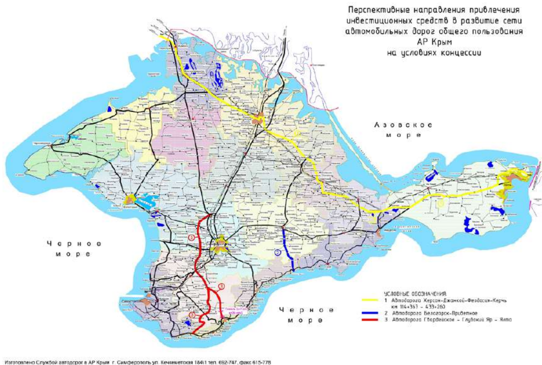
Рис.1. Направления привлечения инвестиционных средств в развитие сети автомобильных дорог общего пользования на условиях концессии.

Одной из автомобильных дорог является международная автомобильная дорога государственного значения Херсон-Джанкой-Феодосия-Керчь. Она является частью европейского коридора E-97 «Херсон – Феодосия – Керчь – Новороссийск – Сочи – Сенаки» и Великого шелкового пути. Существующая автомобильная дорога имеет протяженность 319,2 км (км 114+367- 433+260), в том числе II категория – 203,8 км, III категория – 51,4 км, IV категория – 53,9 км. Проект предусматривает реконструкцию, капитальный ремонт, строительство новых участков и объездных автодорог. Ориентировочная стоимость составляет 6,5 млрд. грн.