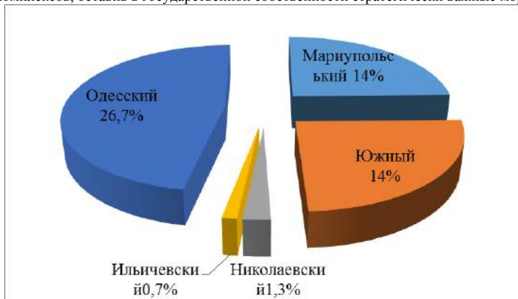
Рис.2 Доля крупнейших морских портов в общей чистой прибыли МТП Украины

Для решения этой проблемы предлагается оставить в государственной собственности специализированные имущественные комплексы портов и их подразделений (судоходные каналы, причалы всех категорий, другие гидротехнические сооружения, навигационное оборудование и службы, портовый флот, закрепленные за портами территории и акватории, системы сигнализации, энерго-, водоснабжения автомобильные, железные дороги и территории портов); привлечь для ведения хозяйственной деятельности на территории портов субъектов предпринимательской деятельности и организаций различных форм собственности на условиях совместной с портом деятельности или на условиях аренды производственных мощностей порта. Еще одной альтернативой является приватизация малых портов как целостных и имущественных комплексов, оставив в государственной собственности стратегически важные морские порты.