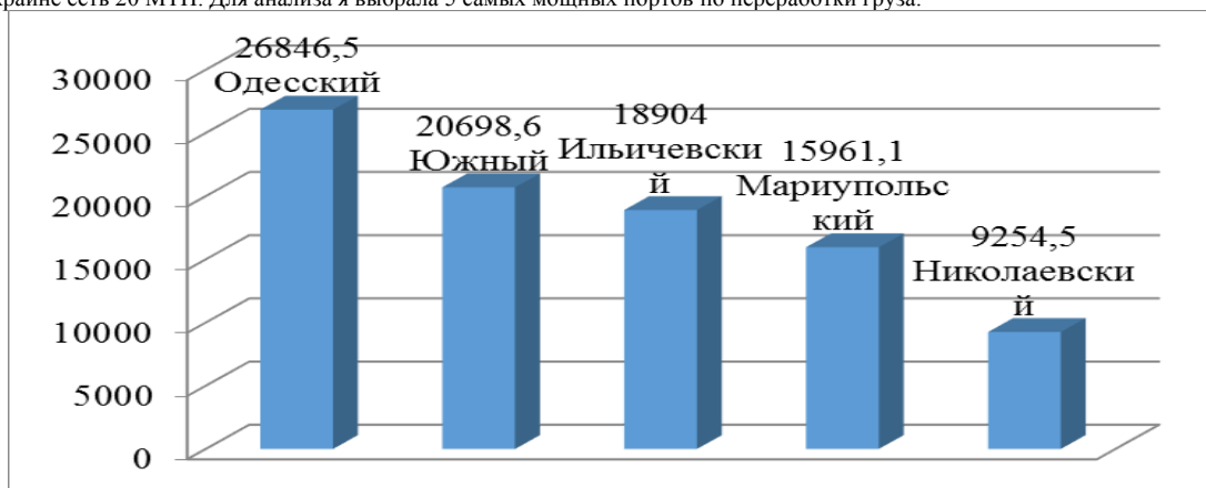
Рис. 1 Переработка груза крупнейших МТП Украины

В Украине есть 20 МТП. Для анализа я выбрала 5 самых мощных портов по переработки груза.