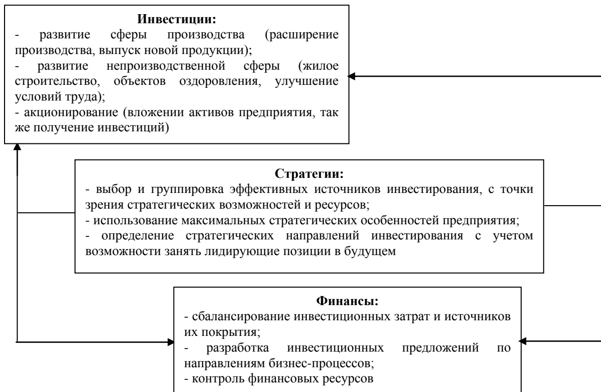
Рис.2. Параметры обеспечения финансово-инвестиционного потенциала предприятия составлено на основе источников [12;15; 16; 21; 24; 25]

Так же обеспечение финансово-инвестиционного потенциала предполагает постоянное расширение инвестиционной деятельности предприятия. В результате увеличения объемов производства, обновления и качественного совершенствования производственного потенциала, необоротного капитала предприятия, повышение технологического уровня производства и его обслуживания, происходит рост экономического потенциала, способствует увеличению эффективности деятельности предприятия. Темпы роста финансово-инвестиционного потенциала зависят от использования собственных ресурсов предприятия и привлеченных инвестиций. Как любой процесс, обеспечение финансово-инвестиционного потенциала отражают определенные параметры, которые отражены на рисунке 2