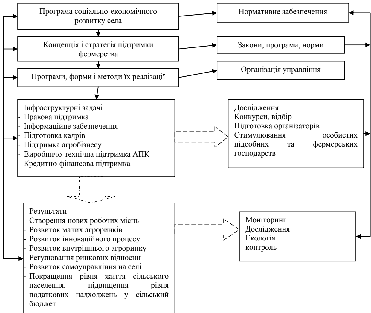
Рис.2. Схема функціонування підтримки фермерства на селі

Для розвитку успішних фермерських господарств на регіональному рівні необхідна програма заходів направлена на: створення умов для розвитку агробізнесу; створення інфраструктури підтримки фермерства; організацію системи підготовки кадрів для підприємницької діяльності; створення фінансово-кредитних механізмів та інститутів; розробку, експертизу та відбір перспективних бізнес-проектів [5].