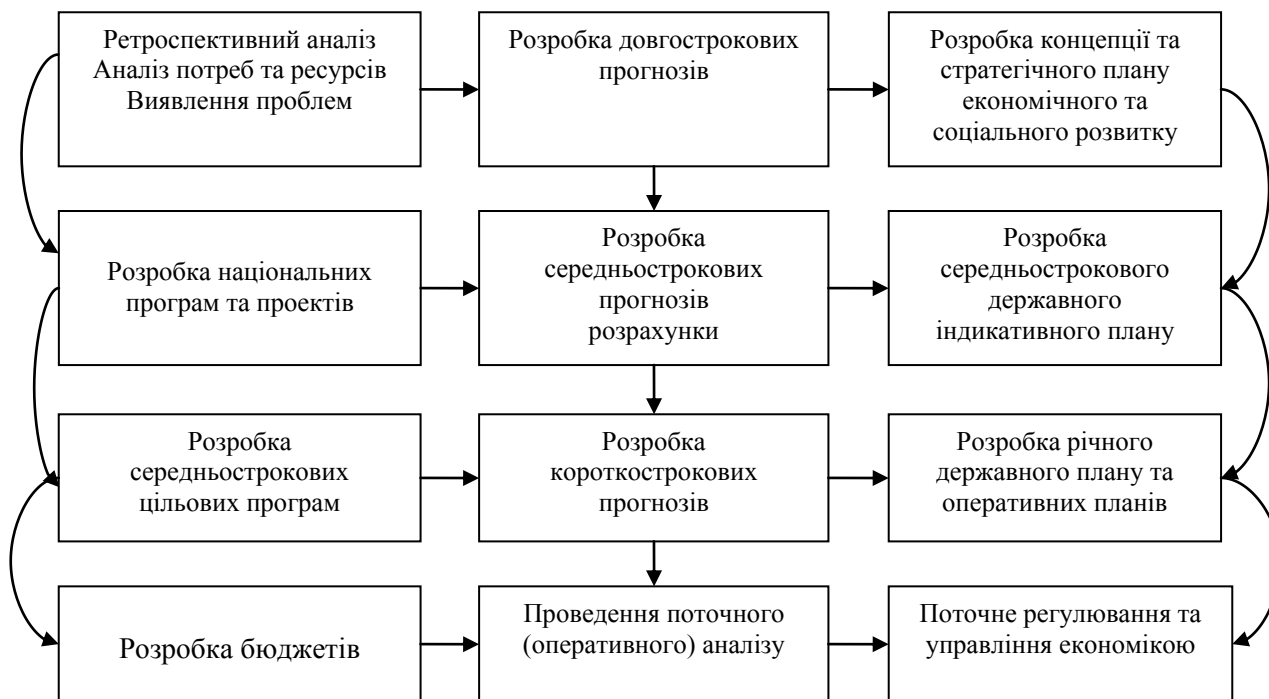
Рис. 1 Фази прогнозування, стратегічного планування та регулювання регіонального розвитку

Його завдання – не тільки привести обрані пріоритети і національні проекти в єдину систему та здійснити їхнє ранжування, але і збалансувати довготривалі цілі з іншими цілями соціально-економічного розвитку, з ресурсами безперервного розвитку країни – людськими, природними, матеріальними, фінансовими. При цьому необхідно враховувати зв'язки національної економіки зі світовою, а також логіку зміни фаз технологічних та економічних циклів, періодичність криз. Стратегічний план може передбачати можливі альтернативні варіанти (у формі, наприклад, діапазону основних показників) залежно від зміни зовнішніх і внутрішніх умов розвитку країни (регіону) [4, с.25]. Такий документ є директивною для уряду і структур державного сектору, а також стратегічним орієнтиром, що формує очікування та мотивації в бізнесовому секторі і серед населення. З певною періодичністю стратегічний план необхідно коригувати і подовжувати його часовий горизонт. Конкретним механізмом реалізації пріоритетів в межах стратегічного плану є державні цільові програми на середньострокову перспективу, що є, як свідчить світова і вітчизняна практика, дієвим інструментом стратегічного управління.