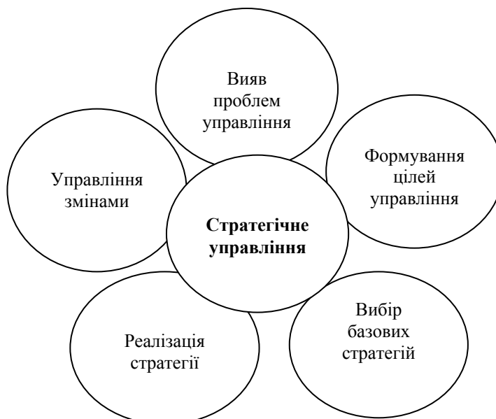
Рис. 3 Складові стратегічного управління регіональним розвитком

Пошук шляхів більш успішної реалізації стратегії також є безперервним процесом. Одні стратегічні завдання вирішуються легко, інші ніяк не піддаються вирішенню. Реалізація стратегії можлива при спільному впливі всієї сукупності управлінських рішень і реалізації поетапних дій, виконуваних різними цільовими групами та окремими особами [13, с.6].