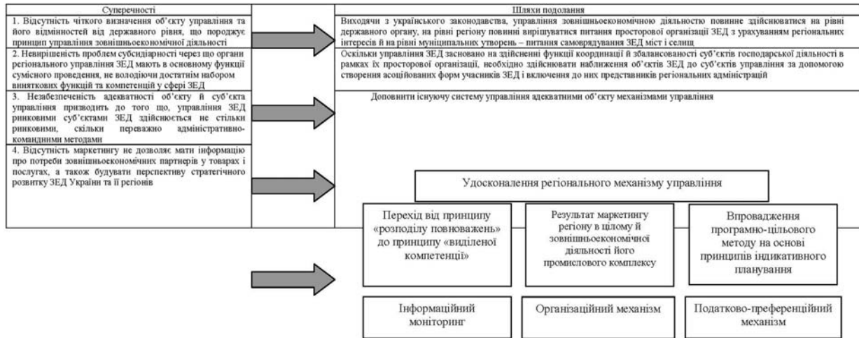
Рис. 1. Суперечності в системі управління зовнішньоекономічною діяльністю України та шляхи їх подолання

В Україні склалася ситуація, коли на тлі продекларованої державної політики щодо всілякої підтримки вітчизняних експортерів, регіональними органами влади не завжди створюються умови для розвитку місцевих експортерів.