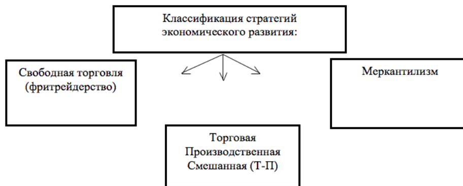
Рис. 1. Классификация стратегий экономического развития стран [1]

Существует большое количество различных классификаций стратегий экономического развития стран. На основе изученного материала, приведем общую классификацию (рис. 1).