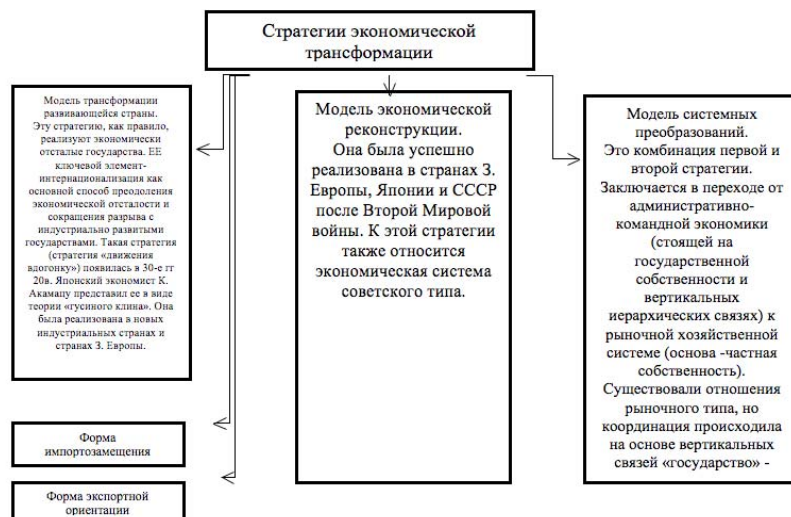
Рис. 3. Стратегии экономической трансформации

Под влиянием глобализации страны мира осуществляют своего рода трансформацию (рис. 3).