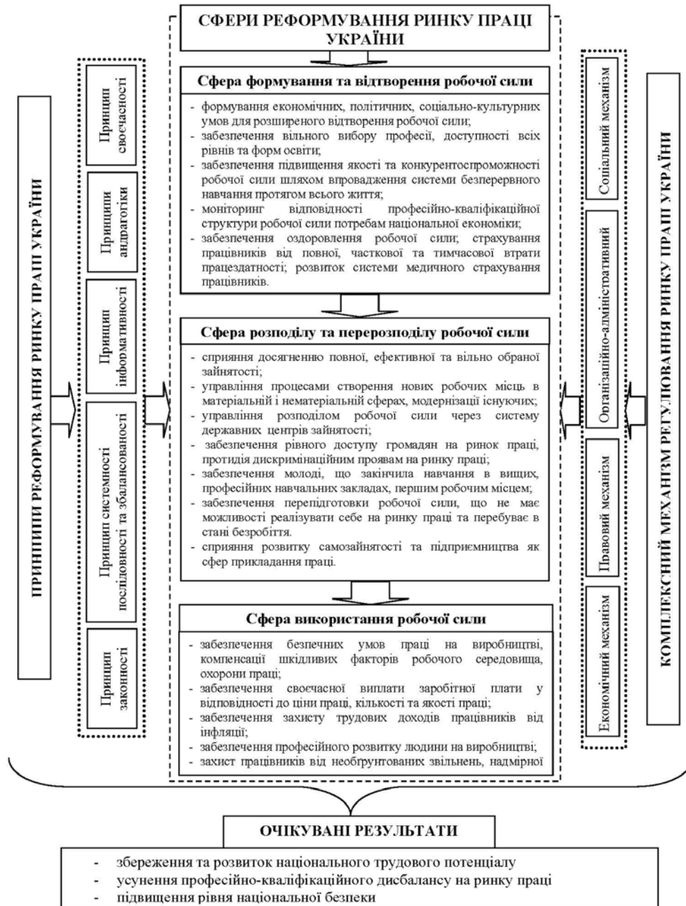
Рис. 2. Структурна схема реформування ринку праці України

З точки зору автора, в сучасних умовах розвитку національної економіки постає необхідність розробки дієвого комплексу заходів регулювання ринку праці, що охоплював би сфери формування та відтворення, розподілу та перерозподілу і використання робочої сили, спрямованого на реформування та трансформацію національного ринку праці у відповідності до тенденцій розвитку світової економічної системи.