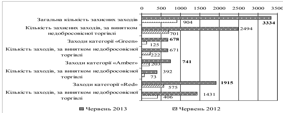
Рис. 1. Загальна кількість заходів щодо обмеження світової торгівлі, що зберігаються в базі даних ГТА за період з 2012 до 2013 рр., зростаючим підсумком

На рис. 1 наведено динаміку застосування протекціоністських заходів у післякризові роки.