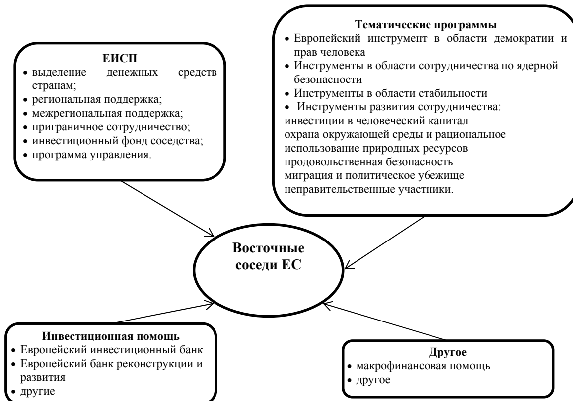
Рис. 3 Программы финансовой помощи ЕС в странах восточного соседства

Всеобъемлющая политика соседства, включающая соответствующие компоненты всех трех «столпов» нынешней структуры Союза, направлена на обеспечение соседним странам возможности воспользоваться благами расширения ЕС в том, что касается стабильности, безопасности и благосостояния. Отношения между ЕС и большинством участвующих в ЕПС стран уже находятся на высоком уровне. В Восточной Европе в основе договорных отношений лежат соглашения о партнерстве и сотрудничестве. В Средиземноморье региональной основой сотрудничества является Евро-Средиземноморское партнерство («Барселонский процесс»), который дополняет серия соглашений об ассоциации.