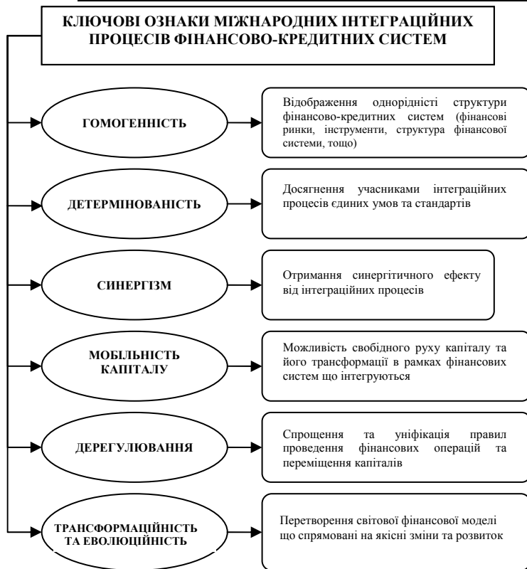
Рис. 2. Узагальнення ознак інтеграції фінансово-кредитних систем у світовому просторі (складено автором)