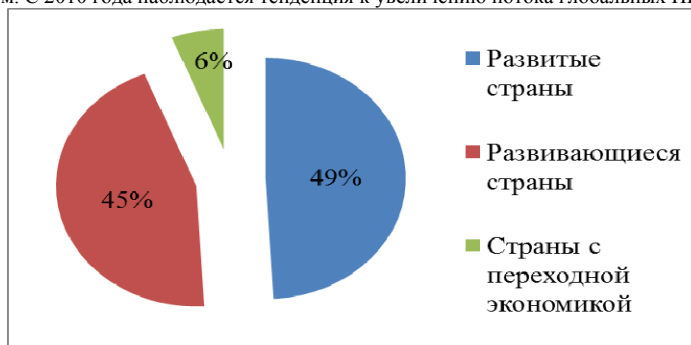
Рис. 2. Приток ПИИ по регионам за 2011 год в %. [4]

Как видно из рисунка 1, пик потока глобальных ПИИ приходился на 2007 год. Затем отмечает спад до 2009 года в связи с финансово-экономическим кризисом. С 2010 года наблюдается тенденция к увеличению потока глобальных ПИИ.