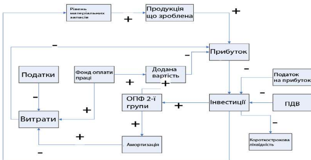
Рис. 2 Діаграма причинно-наслідкових зв'язків моделі